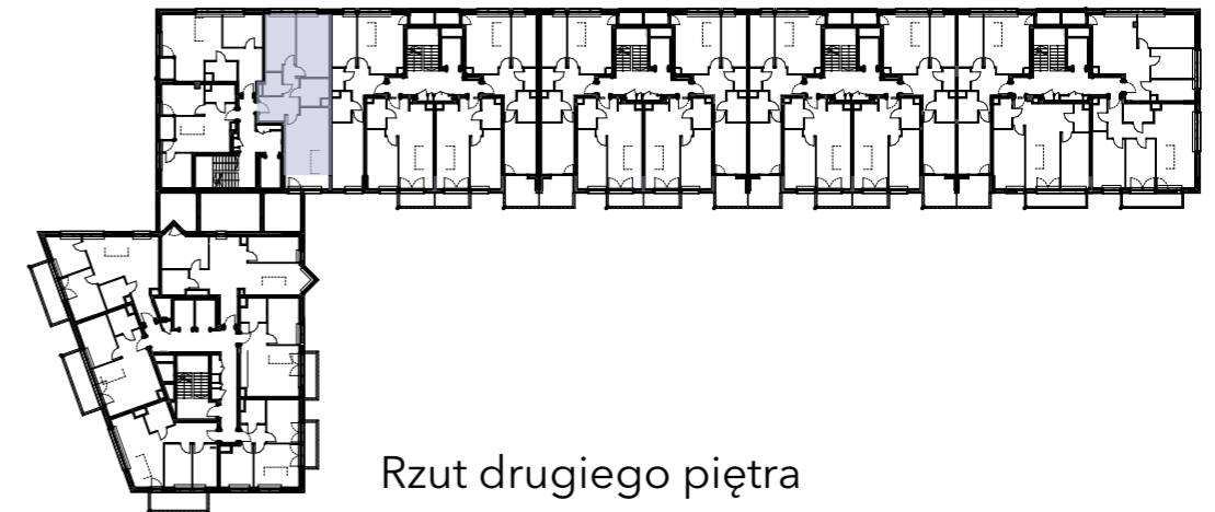
Rzut drugiego piętra